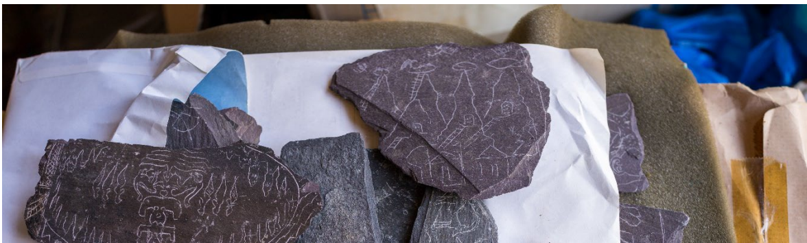
Şist üzerinde James Mellaart tarafından sabte eser üretme amacıyla yapılmış çizimler.