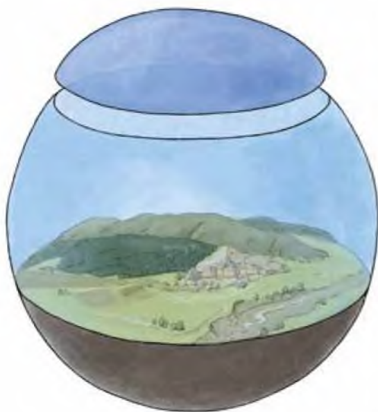
▲ De vier elementen van de Hettitische kosmos zoals symbolisch afgebeeld in het rotsreservaat van Yazilikaya: onderwereld, aarde, hemel en hemelse circumpolaire zone. (FOTO: LUWIAN STUDIES #1418).