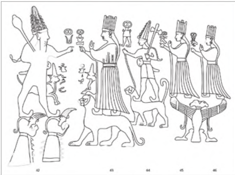
▲ De belangrijkste scène in Yazılıkaya's Kamer A is waar de processies van goden van links en van rechts samenkomen op de lokale meridiaan.