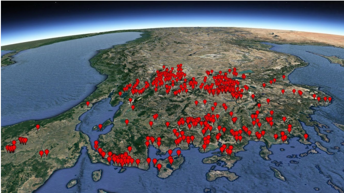
Google Earth-Bild mit den heute bekannten Siedlungen um 1200 v. Chr. im westlichen Kleinasien.