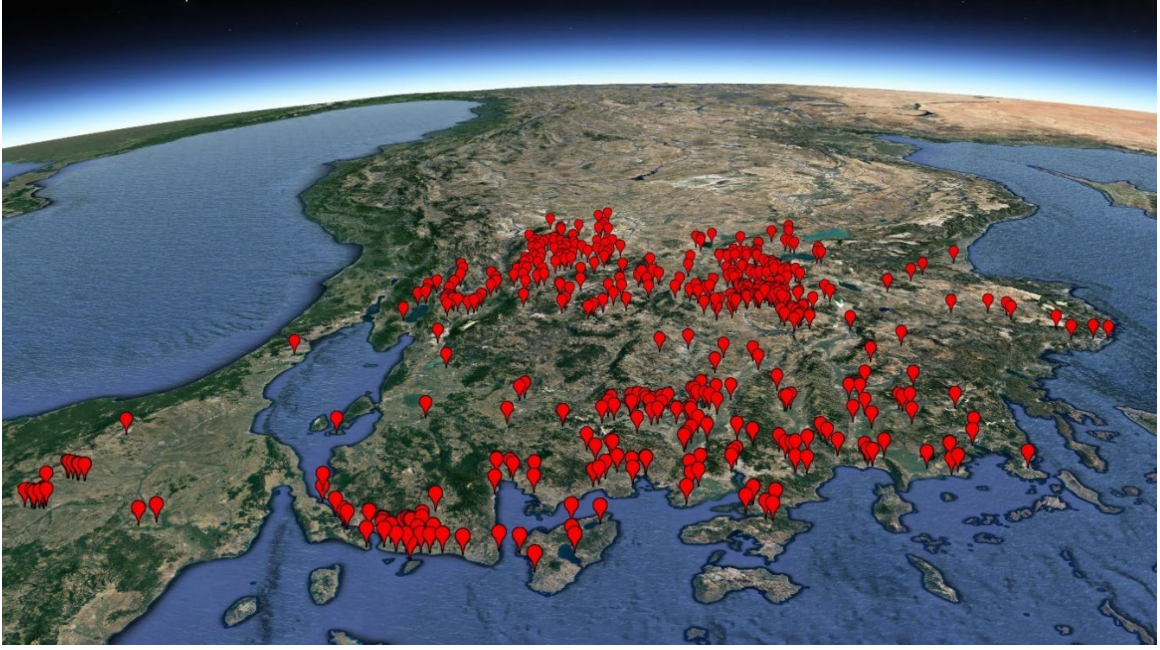
MÖ 1200 civarında Batı Anadolu'da bilinen yerleşim yerlerin işaretlendiği Google Earth görüntüsü.